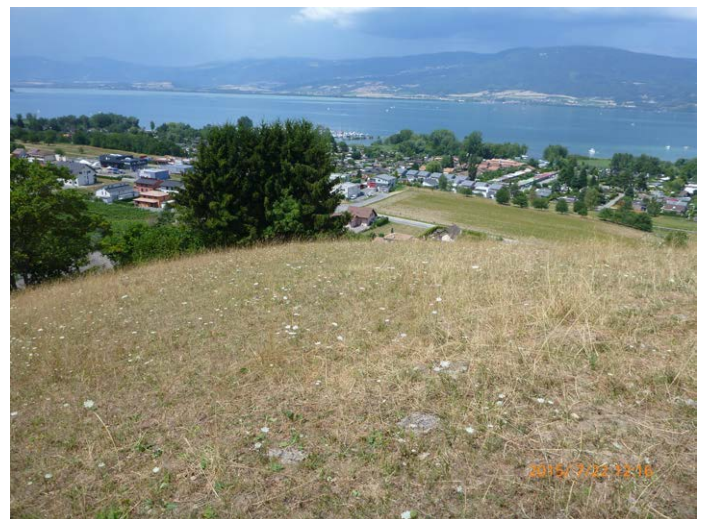
Photos de l'objet 22.07.2015